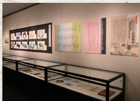
企画展「温故知新の料理物語」