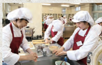
ゼミ授業において江戸・明治の料理書から学生が料理を再現し、写真で展示