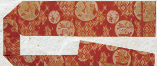
春子先生創案の名古屋帯