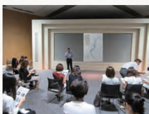
瑞穂消防署の防災講習会に資料提供