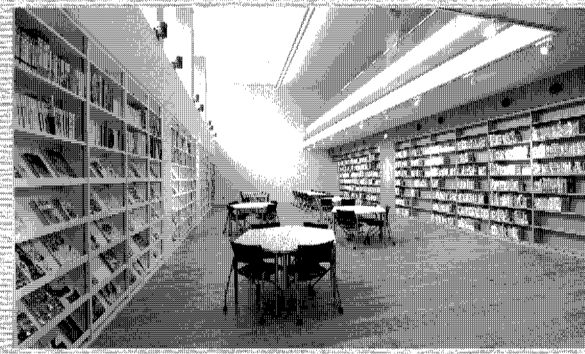
図書館棟1階のラーニング・commons。アクティブ・ラーニングやグループ・ラーニングの場として多目的に利用できる。

この新たな「知の交流拠点」は、施設・設備の面から質の高い学びをこれまで以上に強くバックアップしている。