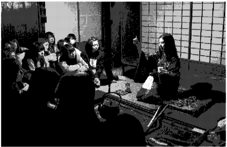
越原(おっばら)学舎研修では、学長から「建学のこころ」を学ぶ。

創設100年を超えた今、心新たに目指すのは、「親切」の層の具現化を通して女性の可能性をより高めていくこと。これからの社会に真に貢献し得る、未来に向かって力強く歩き続ける女性を育て、次の100年を切り拓くこと。その歩みは着実に進んでいる。