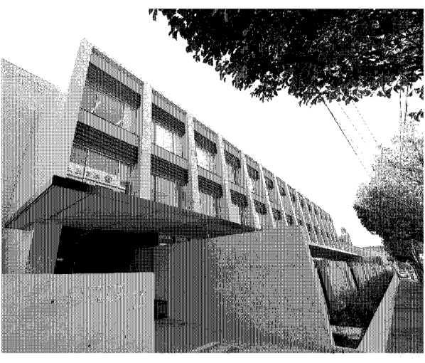
新設された南8号館外観

今、国の施策として女性の活用が強く打ち出されているが、女性の社会進出が極めて稀で、参政権さえもまだなかった大正時代に、その可能性を信じ、女子教育の大切さを訴え、実践したのが、創立者の越原春子先生だ。日本初の女性衆議院議員として活躍し、近代日本の