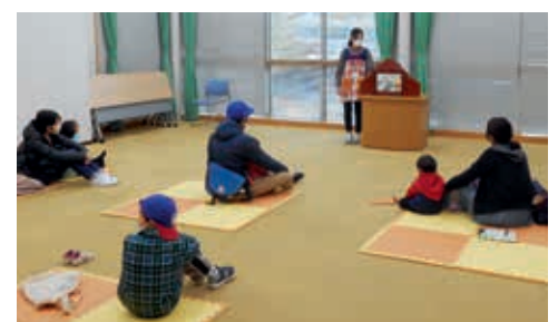
12月に開催したおはなし会