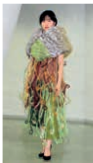
「心」 短期大学部生活学科卒業