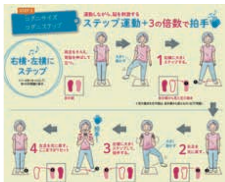
コグニサイズの一例