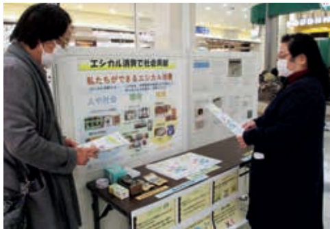
パネル展示会場の様子