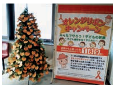
瑞穂区役所に設置されたツリー(2枚とも)