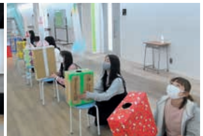
空気ロケット発射