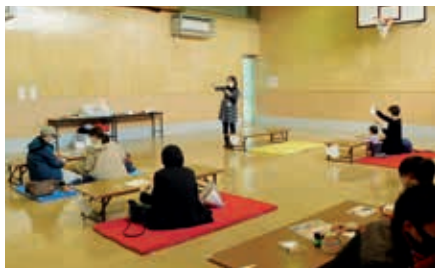
お子さんの写真を使ったカード作り