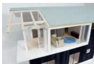
「日常の中間領域」 家政学部生活環境学科卒業

※上記作品は、越原記念館企画展「学生作品選抜展2021」(2021.3/13～8/15)にて展示しています。