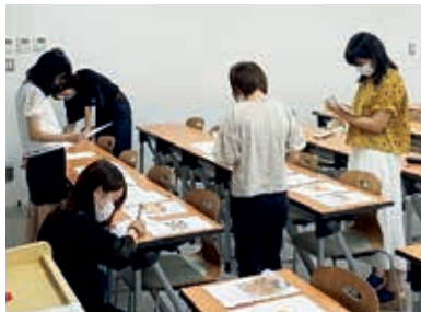
授業内でレシピの評価を行う様子