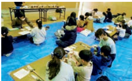
木材を使ったおもちゃ作り