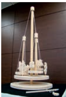
「魚のメリーゴーランド」 文学部児童教育学科卒業