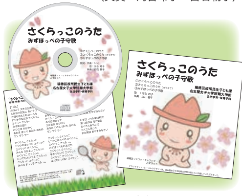
完成した CD デザイン