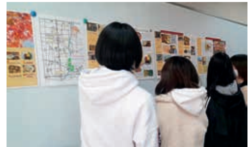
紙面の打ち合わせをする学生