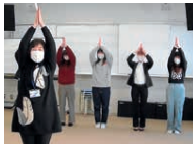
ドレミを体で表そう