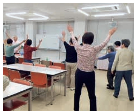
参加者全員で健康体操