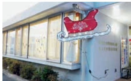
クリスマスのイルミネーション