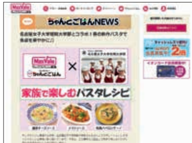
完成したレシピカードとホームページ掲載